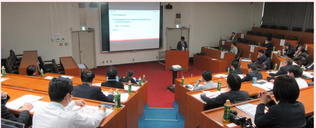
第2回研究会 《働き方改革：事例に学ぶ》