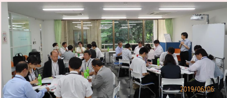
第3回研究会 ケーススタディ