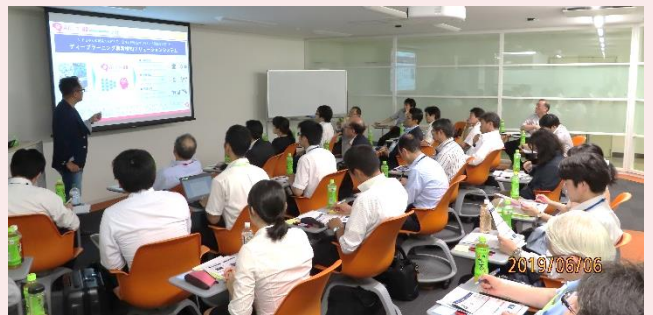
第3回研究会 講演会

最終年度となる次年度は、これまでに引き続き機械学習の活用に関する話題提供をするとともに、グループに分かれて実習形式でプログラムを作成し、AI活用に結びつく知見と技術を得るための構成で進める計画です。その準備として、これまでのケーススタディに代わり、3月の研究会ではプログラミング言語Pythonを利用した機械学習に関する演習を予定していました。今後、この演習を実施した上で実習形式へと進む予定です。